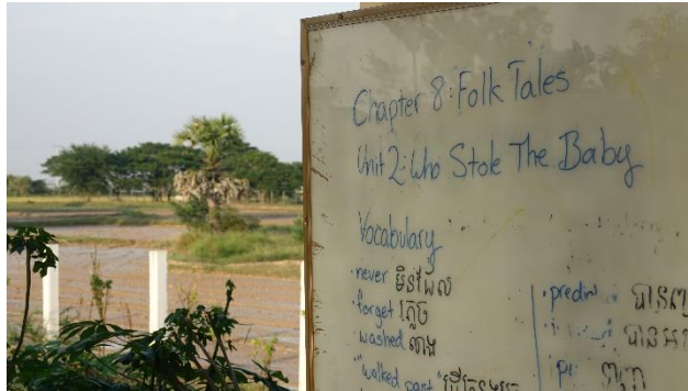
TangKrang, kuva Ilkka Koivisto

Seurakunnat eri puolilla maata nostavat yhteisöjensä elämänlaatua merkittävästi.