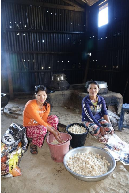
Lailenpin koulun keittäjät