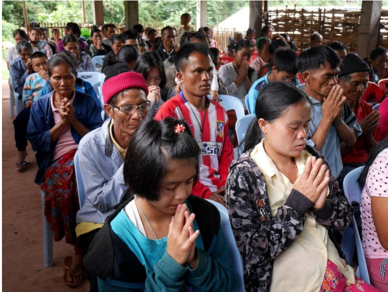
Huai Thoonin seurakunnan jumalanpalvelus