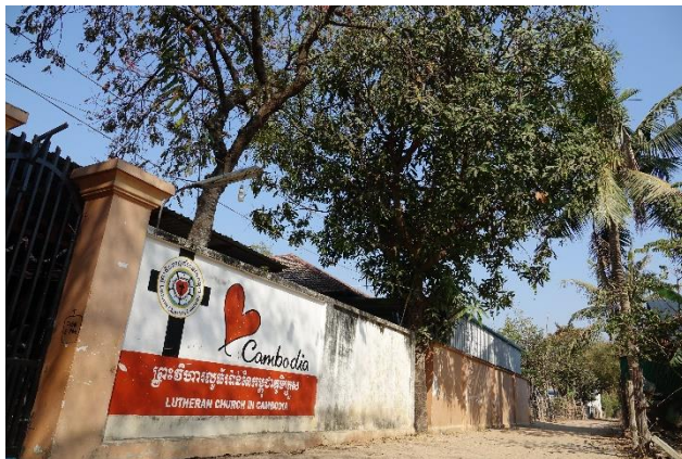
Krous - kirkon aita, kuva Ilkka Koivisto