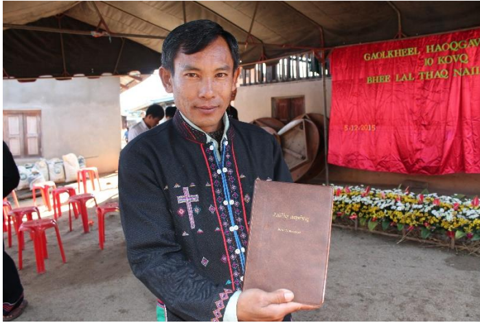
Aken kielinen Uusi testamentti