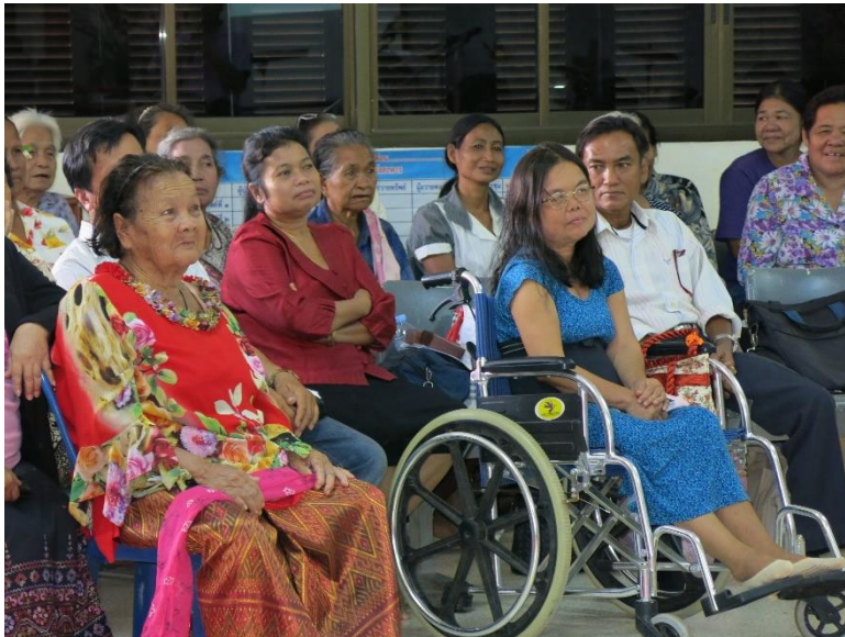
Ubon seurakunnan diakoniatyön juhla

Seurakunnat tavoittavat ympäristöissään kaikkia ihmisryhmiä, mutta keskiössä on kaikkein heikoimmassa asemassa olevien auttaminen.