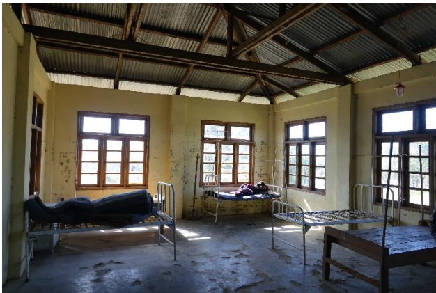
Lailenpin sairaala, kuva Ilkka Koivisto

Syrjäytymisvaarassa olevat lapset ja nuoret, kirkkojen työntekijät ja vastuhenkilöt, kristillisen sanoman ulkopuolella olevat