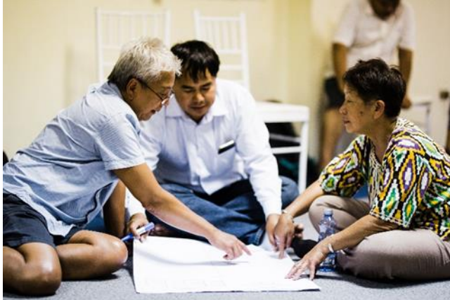
Ideariihä kirkkojen federaation kokouksessa