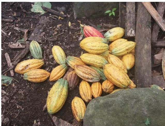
Kaakaolla kohti uutta toimeentuloa

Vuoden 2021 alussa presidentti Duque ilmoitti yllättäen uudesta historiallisesta säädöksestä. Sen mukaan kaikki maassa oleskelevat paperittomat venezuelalaiset saavat väliaikaisen suojelun ja laillisen asumisen Kolumbiassa 10 vuodeksi. Tämä avaa heille ovet mm. terveydenhoitoon, koulutukseen ja muihin peruspalveluihin sekä lailliseen työntekoon. Toinen presidentin tekemä tärkeä päätös on konfliktin uhrien oikeuksia ja korvauksia koskevan lain (Ley de Victimas) voimassaolon pidentäminen 10 vuodella aina vuoteen 2031 asti. Näin on edelleen olemassa kanava saada lakisääteisesti oikeutta maan n. 9 miljoonalle konfliktin uhrille.