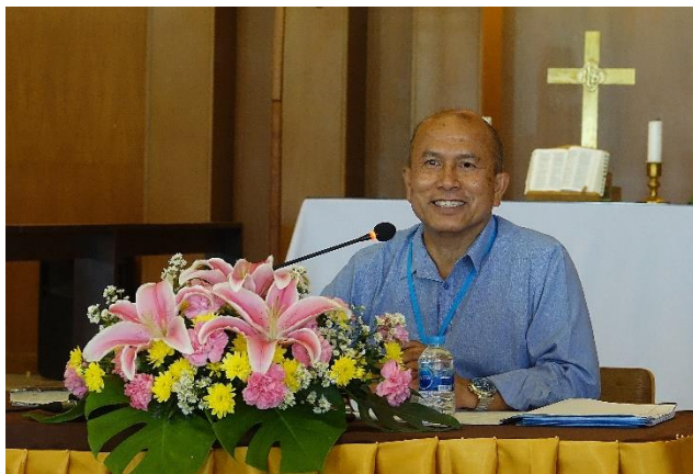
Thaimaan luterilaisen kirkon piispa Amnuay Yodwong