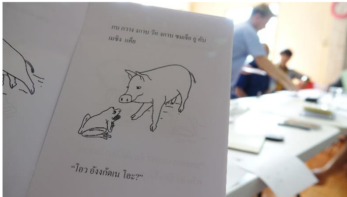
Uutta opetusmateriaalia