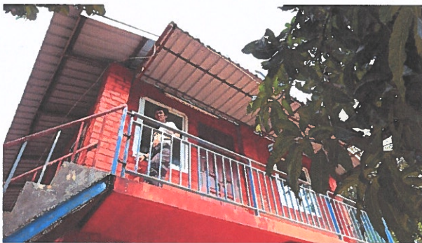
Myanmarin Luterilaisen seminaarin yläkerrassa oleva kirkko ulkoapäin.

Kaikkien neljän kirkon parissa on paljon köyhistä oloista kotoisin olevia nuoria. Kirkon työntekijöiden koulutus- ja osaamistaso on myös varsin heikko.