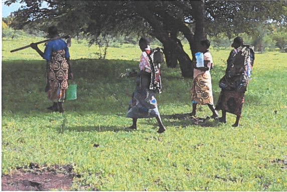
Kyläläiset lähtevät istuttamaan puun taimia Tansanian Kishapussa.

Helsingin seurakuntayhtymä ja Suomen Lähetysseura ovat tehneet vuodesta 2019 alkaen yhteistyötä ilmastonmuutoksen vastaisessa työssä. Yhteistyön alkuna toimi v. 2019 Hope Fund -kompensaatorahaston kehittäminen, jonka yhteydessä käytiin alustavaa keskustelua yhteistyön jatkamisesta v. 2020 päästökompensaatiolaskurin ja verkkosivuston kehittämisellä.