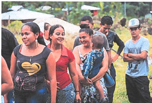
Psykososiaalisen tuen workshop

Kansainvälisellä yhteisöllä – kansainvälisillä kansalaisjärjestöillä, hallituksilla, monenvälisillä järjestöillä ja diplomaattisella yhteisöllä - on tärkeä rooli rauhanrakentamisen tukemisessa Kolumbiassa. Tällainen tuki on kriittistä, kun näyttää siltä, että kansallisella tasolla ei ole edistytty riittävästi ja näkyvyyden ja suojelun tarjoamisessa kumppaneille, joilla on vakavia riskejä. Vaikuttamistyö oikeudenmukaisen rauhan puolesta, jotta yhteisöjen tarpeet huomioidaan ja että rauhansopimusten täytäntöönpanoon saadaan kansainvälistä tukea, on hyvin tärkeää.