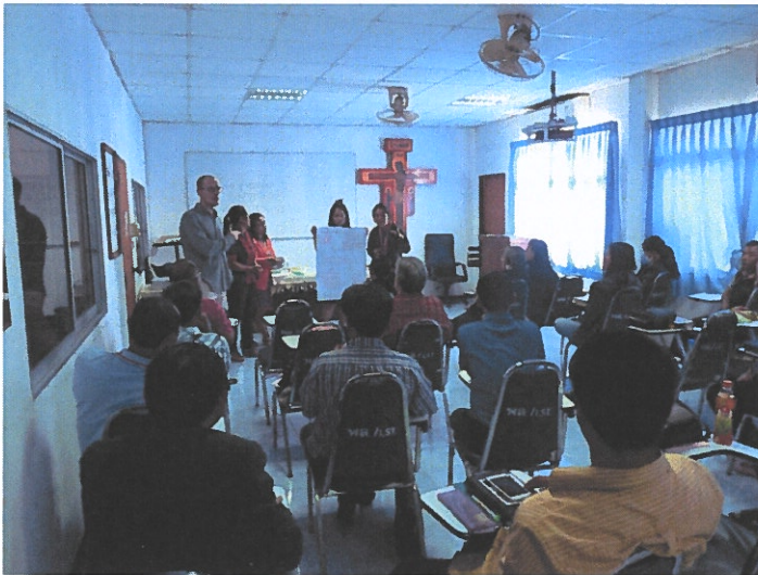
Yhdessä oppimisen iloa - ryhmätöitä LST:ssa.

Thaimaan, Kambodžan ja Myanmarin luterilaisten kirkkojen jäsenistöstä on noussut tutkijoita, joiden julkaisemat tutkimukset ovat merkittäviä puheenvuoroja kontekstuaalisen teologian ja luterilaisen teologian alueella. Lähetysseuran kumppaneiden työntekijöistä 30% on saavuttanut Master of Theology tai Master of Arts tasoisen loppututkinnon.