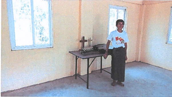
Myanmarin Luterilaisen seminaarin yläkerrassa olevan kirkkosalin alttari.

Lähetyksseura tukee neljän pienen luterilaisen kirkon kokonaisvaltaista työtä yhteisöjen elämänlaadun parantamiseksi eri puolilla Myanmaria.