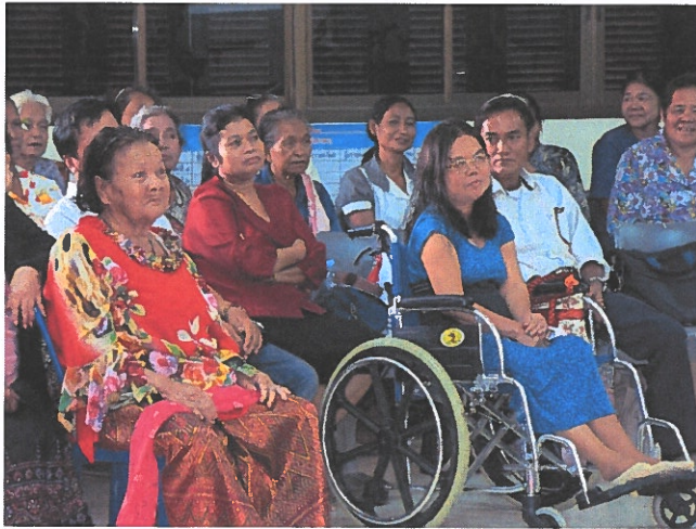
Ikäihmisten juhla Ubon seurakunnassa

Diakoniaosastolla on toimiva varainhankinnan suunnitelma, jonka merkitys kasvaa vuosittain.