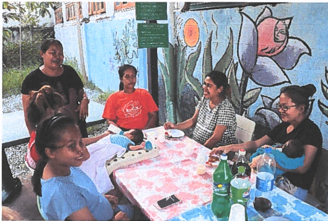
Äitejä Armonkodin pihakahvilassa

Diakoniaosasto pystyy omalla varainhankinnallaan kattamaan yhä kasvavan määrän toiminnasta aiheutuvista kuluista.