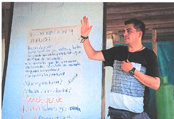
Psykososiaalisen tuen workshop, kuva Albin Hillert

Entisten taistelijoiden kotouttamista koskevien ohjelmien heikosta täytäntöönpanosta johtuva pelko ja poliittisten päätöksentekijöiden epävarmuus ovat luoneet merkittäviä haasteita rauhanrakentamiselle ja sovinnolle. Siksi on suuri tarve työskennellä eri toimijoiden kanssa luottamuksen lisäämiseksi eri yhteisöjen ja ryhmien kesken sekä erityisesti yhteisöjen ja entisten taistelijoiden välillä. Onkin tärkeää luoda turvalliset tilat yksilöille ja perheille ilmaista menetyksiä ja surua, etenkin tuhansille, jotka ovat kadonneet konfliktin aikana. Tarvitaan ohjelmia, jotka toimivat kaikkien osapuolten kanssa vuoropuhelun, viestinnän ja kunnioituksen luomiseksi, jotta voidaan kuroa umpeen epäluottamus uhrien ja tekijöiden välillä. Keskeisessä roolissa tässä ovat mm. paikalliset kirkot ja organisaatiot, jotka jo osallistuvat psykososiaaliseen tukeen ja rauhanrakennustyöhön.