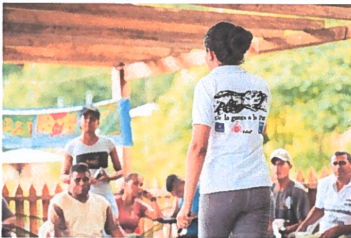
Psykososiaalisen tuen workshop

Kolumbian rauhansopimus, jonka oli tarkoitus päättää yli 50 vuotta kestänyt aseellinen konflikti FARC -sissijärjestön ja maan hallituksen välillä, allekirjoitettiin pitkien neuvottelujen jälkeen vuonna 2016. Sissit luovuttivat aseensa ja siirtyivät erityisille heille osoitetuille alueille, missä heidän piti odottaa rauhansopimuksen ehtojen täyttymistä ja jälleensopeuttamista/kotouttamista yhteiskuntaan. Edellinen presidentti, Juan Manuel Santos, ajoi voimakkaasti rauhansopimuksen solmimista ja sai ponnisteluistaan myös Nobelin rauhanpalkinnon vuonna 2017. Vuosi 2018 oli vaalivuosi ja uusi presidentti Ivan Duque edustaa äärioikeistolaista linjaa, joka vastusti rauhansopimuksen solmimista ja vaikuttaa hyvin vahvasti hallituksen politiikkaan. Rauhanprosessi ei edisty eivätkä rauhansopimuksessa taatut ehdot ole täyttyneet. Osa aseensa luovuttaneista sisseistä on turhautunut odottamiseen ja tarttunut uudelleen aseisiin, mutta suurin osa heistä on edelleen mukana rauhanprosessissa ja haluaa rauhaa.